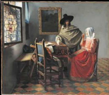
Le Verre de vin (entre 1658 et 1662), Johannes Vermeer.