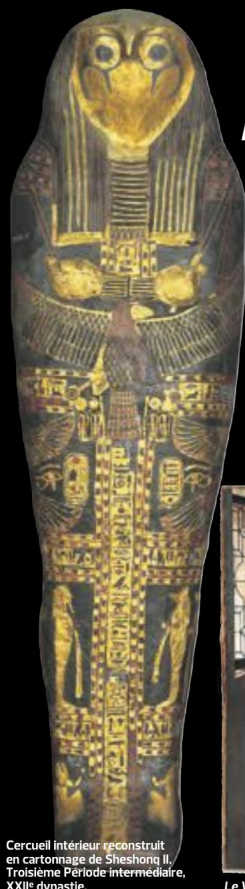
Cercueil intérieur reconstruit en cartonnage de Sheshonq II, Troisième Période intermédiaire, XXII e dynastie.