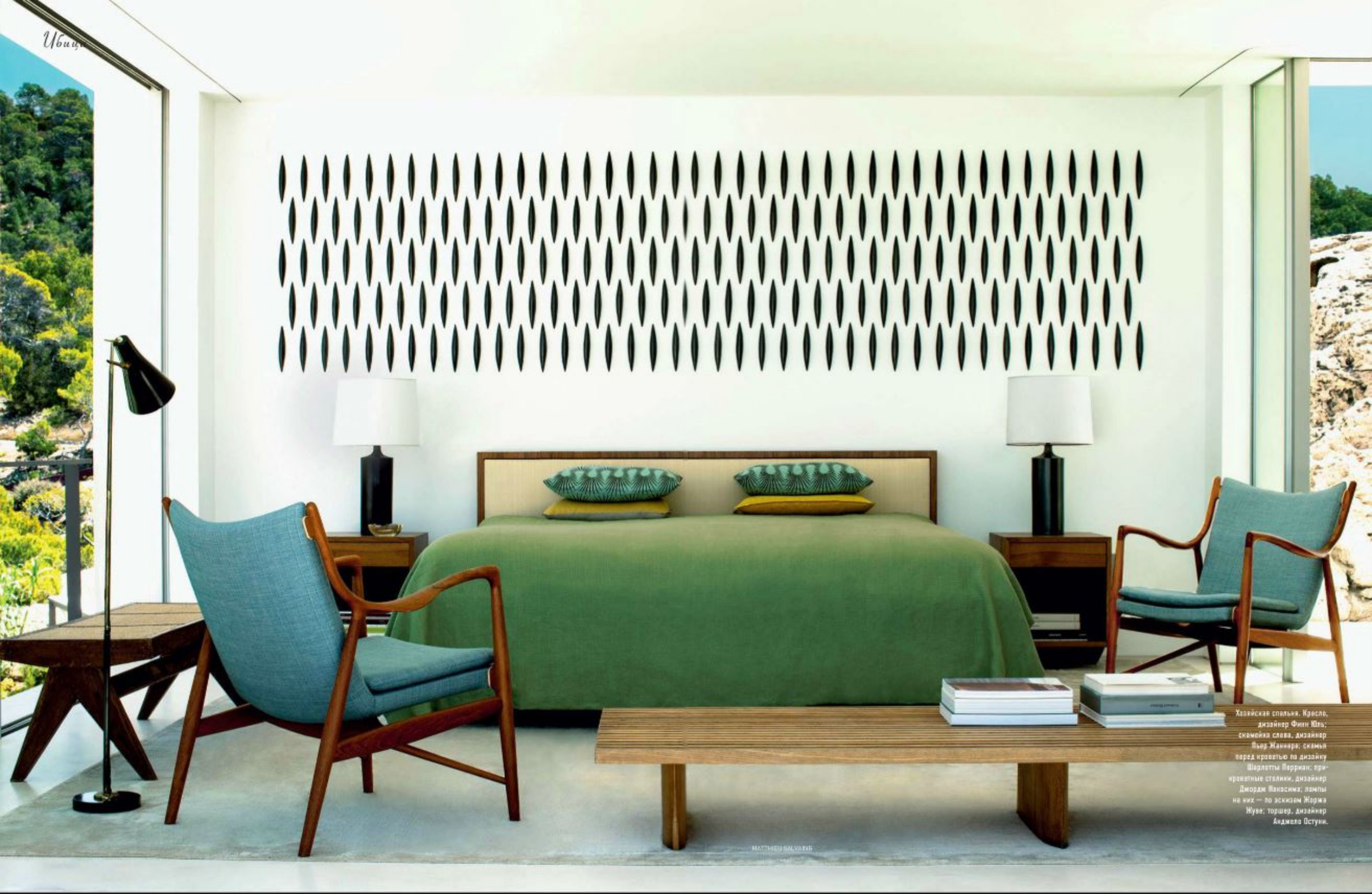
Хозяйская спальня. Кресло, дизайнер Финн Шю; скамейка слева, дизайнер Вьес Жанна; скамья перед кроватью по дизайну Шарлотты Верриан; прикроватные столики, дизайнер Джордж Ванессима; лампы на них — по эскизам Жюльи Нуве; торшер, дизайнер Анджела Остунни.