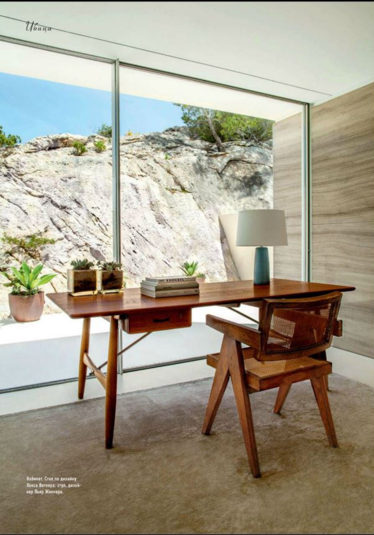
Кабинет. Стол по дизайну Ханса Вегнера; стул, дизайнер Пьер Жаннера.