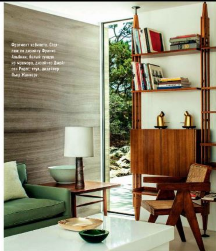
Фрагмент кабинета. Стол по дизайну Франко Альбини; белый сундук из мрамора, дизайнер Джейсон Радес; стул, дизайнер Пьер Жаннера.