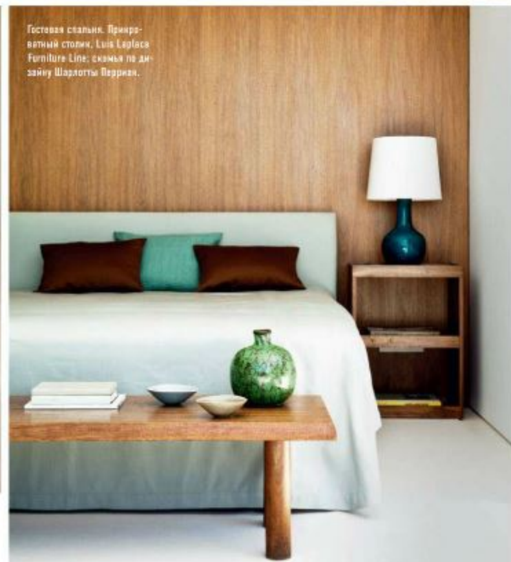
Гостевая спальня. Прикроватный столик, Luis Laplace Furniture Line; скамья по дизайну Шарлотты Перриан.